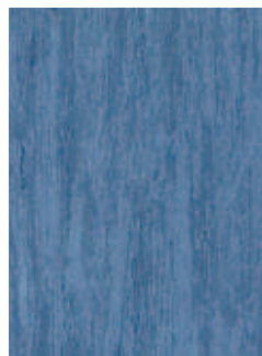
3068 493 Sznur 1287 281