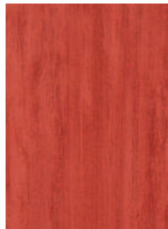
3068 488 Sznur 1287 441