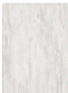
3068 497 Sznur 1287 338