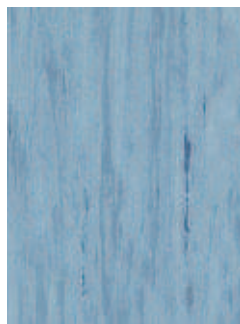
3068 492 Sznur 1291 210