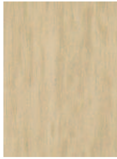
3068 483 Sznur 1287 039