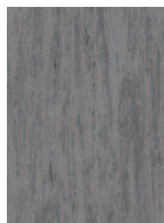
3068 499 Sznur 1287 394