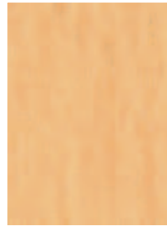
3068 485 Sznur 1287 439