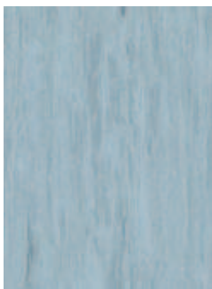
3068 491 Sznur 1287 047