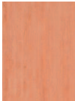
3068 487 Sznur 1288 325