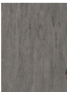
3068 496 Sznur 1287 333