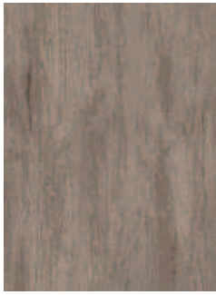
3068 482 Sznur 1287 373