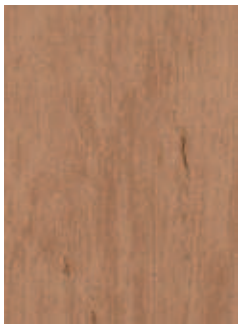
3068 486 Sznur 1287 440