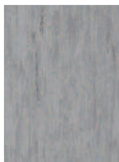
3068 498 Sznur 1287 027