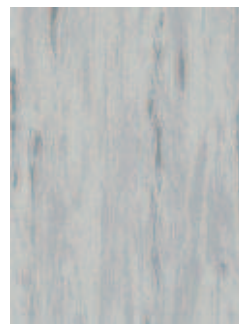
3068 494 Sznur 1294 701