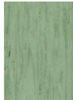
3068 490 Sznur 1287 295