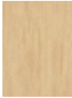
3068 484 Sznur 1287 438