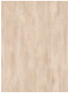
3068 479 Sznur 1287 160