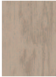
3068 481 Sznur 1287 437