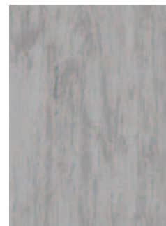
3068 495 Sznur 1294 071