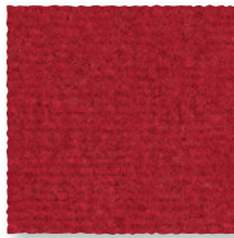
Rubis 570 4 m