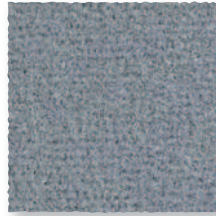
Mistigri 940 4 m