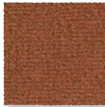
Renard 490 4 m