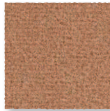
Daim 680 4 m