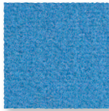
Azur 130 4 m