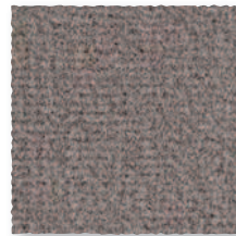
Taupe 770 4 m