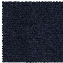
Noir 990 4 m