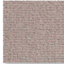
Ourson 780 4 m