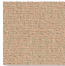
Cannelle 640 4 m