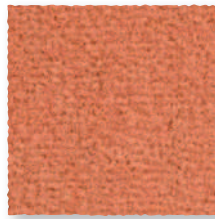
Argile 750 4 m