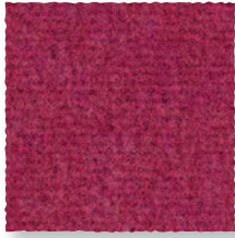
Pivoine 560 4 m