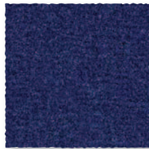
Marine 199 4 m