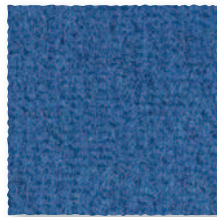
Pétrole 190 4 m