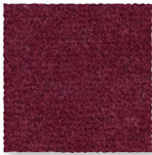
Pourpre 590 4 m