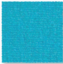
Aqua 125 4 m