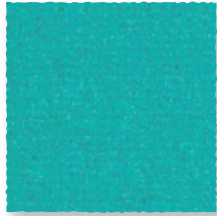
Hawaï 255 4 m