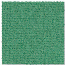
Mousse 240 4 m