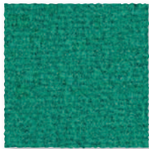
Véronèse 265 4 m