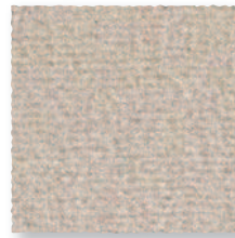
Angora 706 4 m