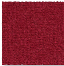
Bordeaux 580 4 m