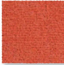
Paprika 550 4 m