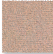
Noisette 740 4 m