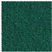
Cèdre 280 4 m