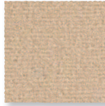
Crème 605 4 m