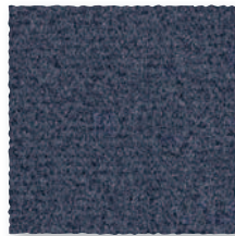
Ardoise 980 4 m