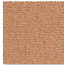
Melon 460 4 m