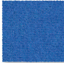
Cobalt 160 4 m