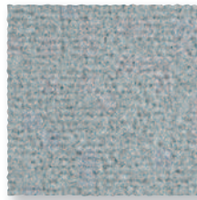
Nuage 910 4 m