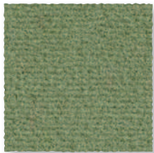
Mélèze 245 4 m