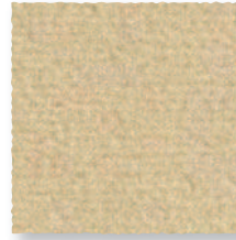
Dune 615 4 m