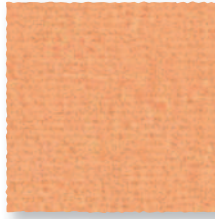
Pêche 440 4 m