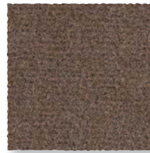
Castor 690 4 m