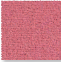
Praline 530 4 m