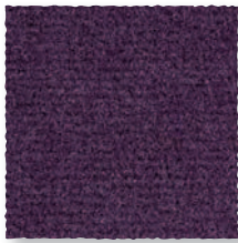
Prune 890 4 m