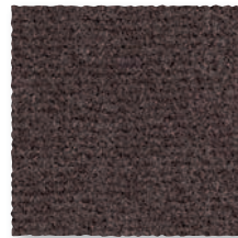
Chocolat 790 4 m