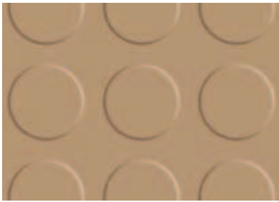
WARS 1242 0301 0 2727 00 416