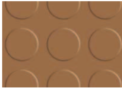
WARS 1242 0303 0 2727 00 466