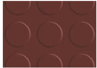
WARS 1242 0341 0 2727 00 436