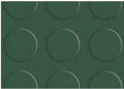
WARS 1242 0362 0 2727 00 609