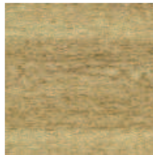
American Oak 3387