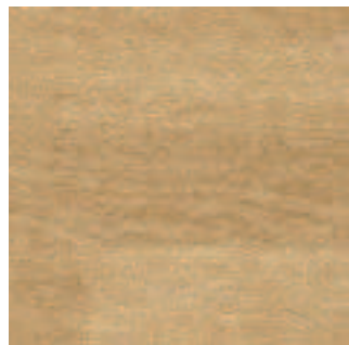
Warm Beech 3297