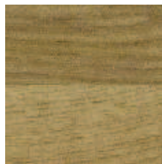
Rustic Oak 3337