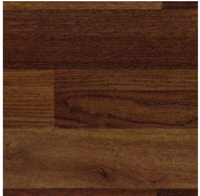
Mahogany 3367 NEW