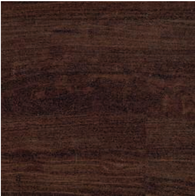
Brazilian Walnut 3997 NEW