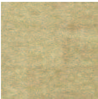
Golden Maple 3277