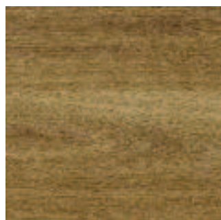
European Oak 3347